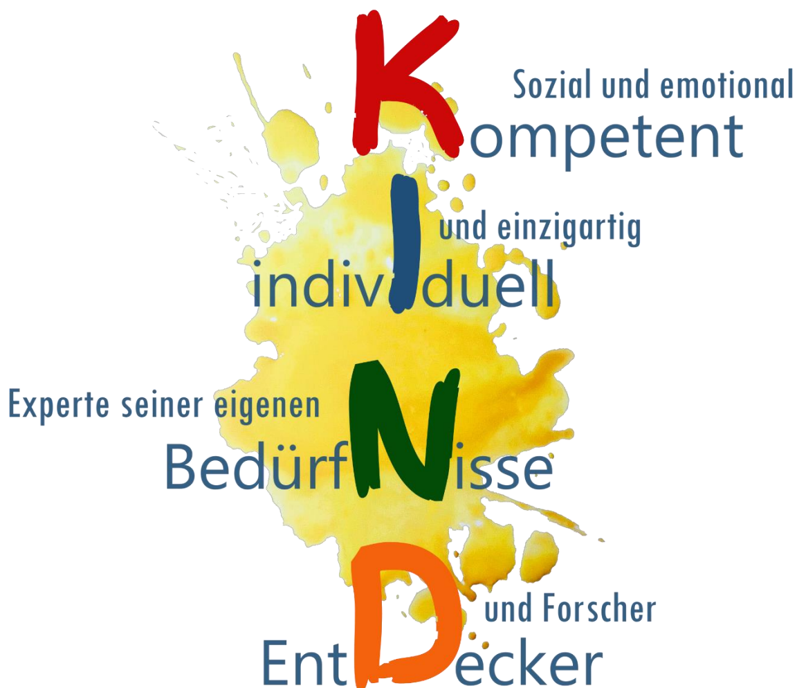
Abbildung: Das kompetente Kind

Wenn ein Kind zu uns kommt, sehen wir, dass es bereits laufen kann, einige sich schon einen Wortschatz angeeignet haben und jedes Kind sich für bestimmte Dinge interessiert. Und das haben sie alles aus sich heraus gelernt, weil Kinder von Natur aus neugierig sind und es ihnen Spaß macht Neues zu entdecken, weiterzugeben und weil das Lernen ihnen hilft unabhängig zu werden. Das heißt, jedes Kind ist von Geburt an ein einzigartiger, vollwertiger Mensch mit individuellen Bedürfnissen, Fähigkeiten, Begabungen und Wahrnehmungen. Es will die Welt mit allen Sinnen erkunden, seine Umgebung begreifen, fühlen, ertasten und verstehen. Und es will von Anfang an aktiv mitgestalten. Die Pädagogik im HoKi basiert auf dem Bild des kompetenten Kindes.